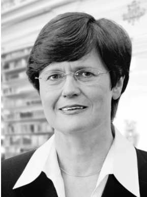
Christine Lieberknecht Thüringer Ministerpräsidentin